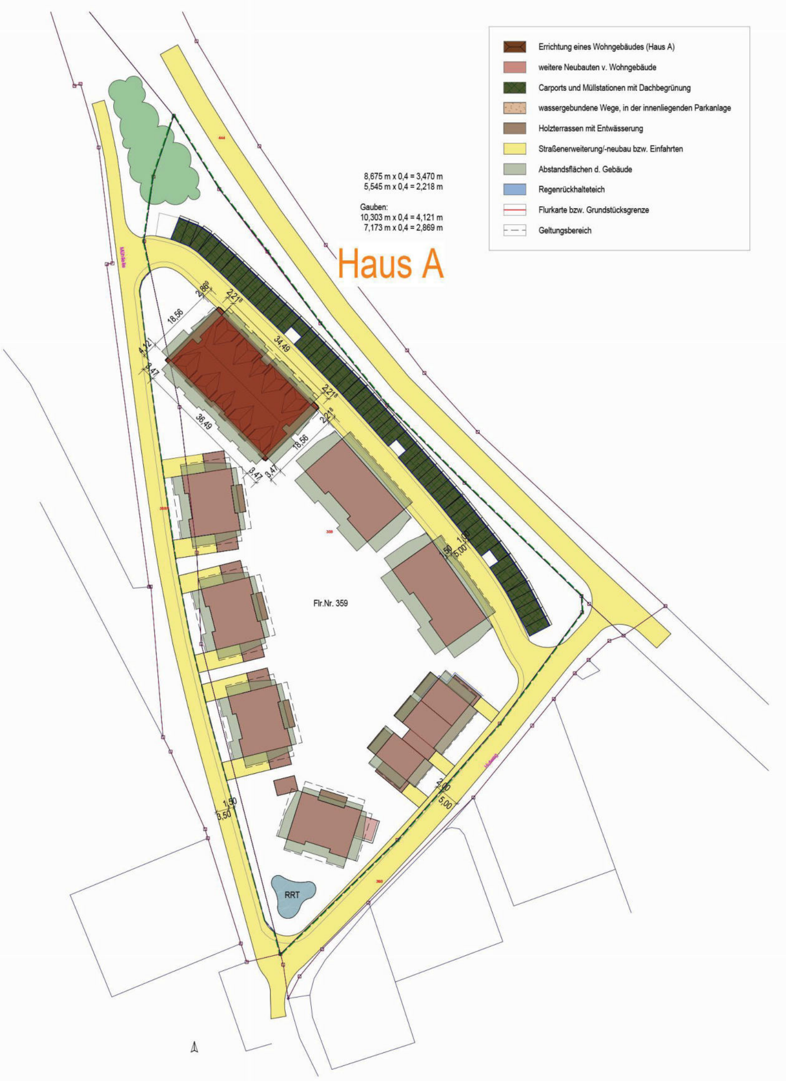
Lageplan mit Abstandsflächen 1:1000